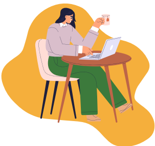
L'assistante Sociale social.passville@rsv84.fr 06 60 45 97 92